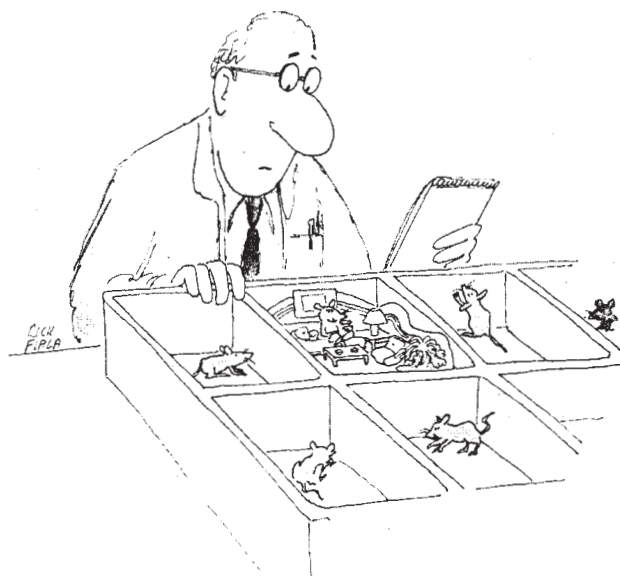
een wetenschapper ontdekt homoseksualiteit bij muizen