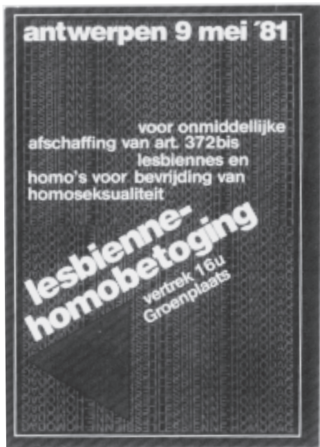
uit "Een ander strand", Antwerpen, stichting Rozegeur, 1982, p 71