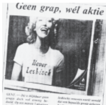
uit Heksenvoer, zonder datum, p 3