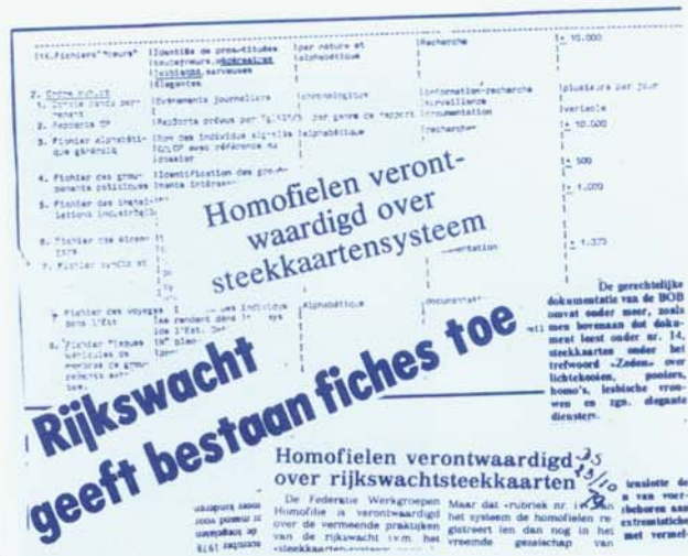
Een collage van knipsels die verschenen naar aanleiding van de onthulling van het bestaan van een registratiesysteem bij de rijkswacht.

Werd het recht dus lang gebruikt om homoseksualiteit te onderdrukken, dan wordt het nu ook een instrument om discriminatie tegen te gaan. De keerzijde van dat succes rechtvaardigt echter enige scepsis betreffende de voorgaande stelling. In de visie van het Europees Hof en de Europese Commissie voor de Rechten van de Mens maakt seksualiteit integraal deel uit van het privéleven. Het fundamentele debat over de maatschappelijke en dus publieke aanvaardbaarheid van homoseksualiteit en lesbianisme als alternatief voor heteroseksuele relaties werd door deze instanties bewust vermeden door gebruik te maken van en