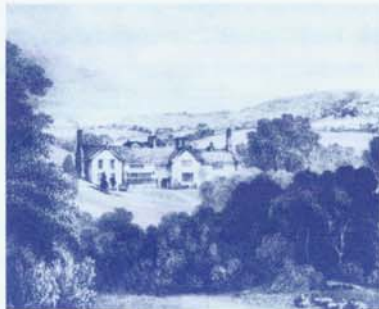
Een zicht op Shibden Hall, circa 1822.

Listers verhaal toont onder meer aan dat het constructivistische kader – dat stelt dat onze seksuele identiteit bepaald wordt door historische en maatschappelijke omstandigheden eerder dan door onze eigen verlangens – op zijn minst genuanceerd moet worden. Lang werd gedacht dat 18e en 19e eeuwse vrouwen zich nauwelijks een seksueel verlangen naar andere