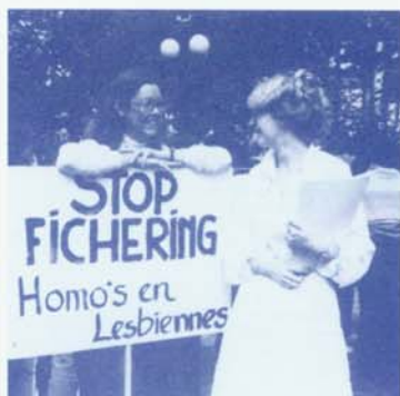
Protest tegen de fichering.