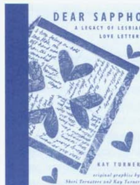
Het verhaal van Anne Lister wijst op het belang van dagboeken en liefdesbrieven. In 1996 verscheen alvast deze bundeling van tientallen lesbische liefdesbrieven.

Fantaseerde Anne er soms over om als man door het leven te gaan, zoals sommige van haar tijdgenotes? Het lijkt weinig waarschijnlijk. Zich vermommen als man zou hebben betekend dat ze haar leven als erfgename had moeten opgeven, en daarmee samen elke hoop op financiële onafhankelijkheid. Bovendien voelde ze zich geen man. Ze hield – als vrouw - te veel van het gezelschap van vrouwen. Mannelijkheid betekende voor haar sociale macht en een uitgesproken seksueel verlangen naar vrouwen, maar daar bleef het ook bij. Anne wilde genieten van de mannelijke privileges, en op het ogenblik dat ze financiële onafhankelijkheid kreeg eigende ze zich dan ook zonder aarzeling de vrijheden toe waar ze al zo lang naar verlangde. Anne Listers combinatie van mannelijkheid en vrouwelijkheid vormden een ondermijning en bedreiging voor de conventionele en scherpe genderdichotomie uit die periode. Annes androgyn verschijning verontrustte haar tijdgenoten omdat ze duidelijk een vrouw was maar het vrouwelijke rolpatroon totaal negeerde. Voor Anne symboliseerde het feit dat ze geen penis had vooral haar gebrek aan sociale macht, maar tegelijkertijd ondergroef haar succes bij vrouwen de veronderstel-