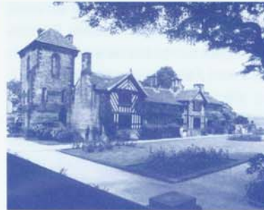
Shibden Hall in 1992.

tonen aan dat Anne over een zeer sterke wilskracht en een enorm doorzettingsvermogen beschikte, dat ze energiek, intelligent, iconoclastisch en nieuwsgierig was, dat ze uitgesproken opinies had en er niet voor terugdeinsde haar omgeving te manipuleren en te