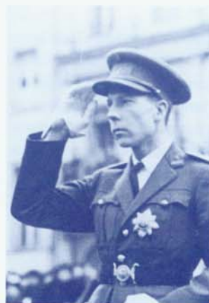
Une photo non datée du prince Charles

Charles se serait alors présenté comme Charles Dawson. Rapidement "Dawson" aurait été invité par l'accueillant Haines, qui lui aurait offert une chambre. La suite est grotesque. Le maître d'hôtel de Haines aurait ensuite remarqué les insignes royaux sur les sous-vêtements de Charles (the guest's Paris-made 'shorts'), révélant ainsi sa vraie identité. C'est évidemment absurde de supposer que Billy Haines ne savait pas qui était vraiment son hôte. En tout cas, pour la presse c'était une aubaine: des histoires homo-érotiques relatives à ces deux 'célibataires' devenaient d'usage à Hollywood.