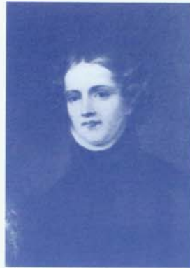
Anne Lister, 1791-1840.

In 1806 keerde ze terug naar Halifax, waar ze het grootste deel van haar leven zou doorbrengen. Door de afwezigheid van andere nazaten besliste haar oom in 1814 dat Anne het Shibden landgoed met boerderijen, pachtgronden, steengroeven en steenkoolmijnen zou erven. Anne zou het landgoed met uitzonderlijke ondernemingszin beheren. Ze was ontzettend ambitieus, met als doel haar lagere afkomst