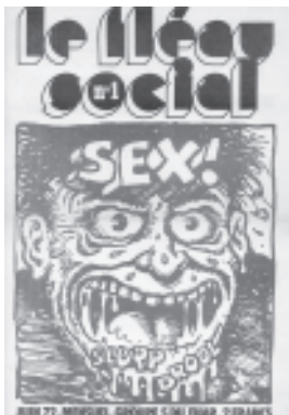
La couverture du premier numéro du périodique 'Le fléau social'.

"Du côté flamand je pense qu'il y a plus facilement une volonté de s'entendre. On doit se coordonner; même si on dispute, on doit se coordonner. Donc on va faire l'effort. Du côté francophone on affirmera beaucoup plus facilement ses différences, et donc on se tapera dessus. Je crois que c'est beaucoup plus culturel."