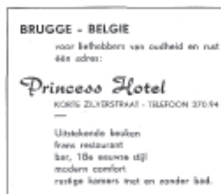
Advertentie voor een Brugs hotel in het Nederlandse homoblad 'Vriendschap', 1960.

Naast het bier – "dat blijft altijd hetzelfde" – waren toen vooral porto, martini en 'samba' (een dreupel met cola) de populairste dranken. Aan zes frank voor een cola en vijftien frank voor een dreupel werd er alvast ook sneller eens een tournée générale gegeven. (De huishuur in de beginperiode bedroeg 1700 frank.) De sigarettenrook moest je er dan wel bij nemen. "Er is altijd veel gerookt. Op de pakjes 'Groene Michel' stond toen trouwens de opdruk: 'Goed voor de gezondheid!'" Daarnaast kon je in de 'Peter Pan' ook terecht voor een boterham of voor een reep chocolade. Muzikaal stonden oude wijsjes en 'slippertjes' of 'vrijerkes' op het menu: rustige dansen waarbij je "op één steen" moest blijven ronddraaien, en waarbij lichamelijk contact mogelijk was. "Trouwens voor bebop was de ruimte veel te klein."