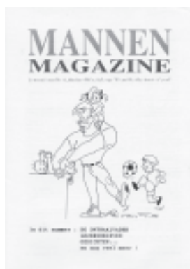
Tijdschrift van de groep Mannen in beweging.