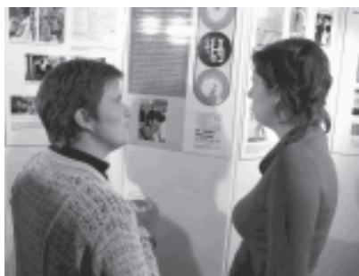
Een fragment van de tentoonstelling 'Toen holebisenioren twintigers waren'.

Geleidelijk aan geraakt onze collectie steeds meer ontsloten, en dat heeft tot gevolg dat we er ook gemakkelijker iets mee kunnen doen. Op vraag van Vieux Rose, de groep voor oudere lesbiennes, doken we naar aanleiding van de Seniorenweek in onze schatkamers voor de inhoudelijke samenstelling van de tentoonstelling 'Toen holebisenioren twintigers waren'. De bedoeling ervan was een beeld te geven van hoe het was homo/lesbisch te zijn in de periode vanaf Wereldoorlog II tot en met de jaren zeventig, en dus meteen ook van de maatschappelijke veranderingen ten aanzien van homoseksualiteit/lesbianisme.