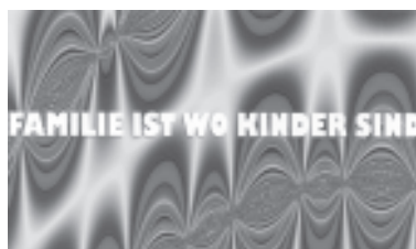
Promomateriaal voor activiteiten van het Spinnboden-archief.