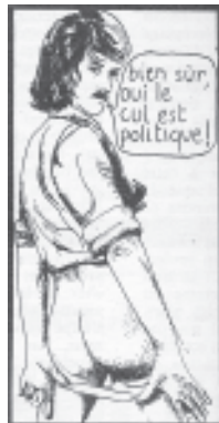
Un dessin, paru dans le premier numéro du périodique 'Le fléau social'.