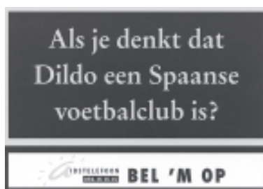
Prentkaart uitgegeven door de StAG.

Het Fonds Suzan Daniel wil de schatkamer van ons allen zijn, de plek