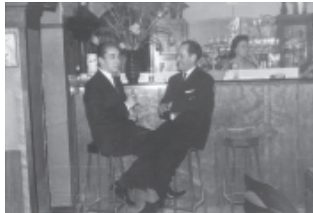
Binnenzicht van café Metro, één van de oudst bekende homobars in Gent.

De 'Parva' bezoeken was toen echter nog een beetje een avontuur. "Toen moest je nog alles wegsteken. En de Korte Meer is een drukke straat, met veel auto's en een tramlijn. Ook al stond de deur open - het vooraf moeten aanbellen, is een praktijk van later - als er een tram passeerde, stapte je gewoon de zaak voorbij. Om niet daar gezien te worden. Want dat was toch wel een beetje een verboden huis, een huis van verderf." Nochtans was het de meest chique van de drie toenmalige homobars. "De 'Ketel' werd uitgebaat door een Duitse vrouw. Haar man was ook voor 't spel. Die zaak was ruimer, maar helemaal niet zo gezellig. Het was er wel geestig hoor, als je er met een compagnie arriveerde. Maar het was er goedkoper: met houten meubels, en geen kussens op de banken." In vergelijking daarmee vertegenwoordigde de 'Parva' een andere klasse. "Dat was veel comfortabeler, met fauteuils voor twee personen en zeteltjes. Dat was de luxe van de jaren 1952. De madam zorgde altijd voor magnifieke schone bloemen. En daar hing wel iets aan de muren, maar convenabel."