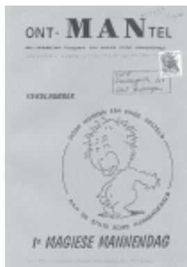
Verslagboek van de 1ste Magiese Mannendag, in het tijdschrift ont-MANtel.

Vooraf voor heteromannen vol goede bedoelingen werd het vaak te veel. Enerzijds door pure frustratie want alles aan hen was machismo en als er al enige verandering merkbaar was, ging het vaak niet verder dan wat meer de afwas doen'. Anderzijds door de strenge moraal die oplegt wat een man wel en niet mag voelen, denken en doen. Daardoor verdwaalden zij in die plotseling ontstane immense vrije ruimte die zo'n mannengroep hen bood. Socialisatie en normalisatie zijn zo ingrijpend dat (deze) mannen zich enorm schuldig en vies gingen voelen wanneer er sprake was van lijfelijk contact met andere mannen. Begeleiding bij dit soort moeilijke processen was gebrekkig of bestond helemaal niet. Na een tijdje zat je dus met een groepje homo's en bi's. De mannenbeweging bereikte het stadium van 'huiskamerbeweging' zonder politiek engagement. Voor sommigen dienden er dus dringend actiemiddelen of op z'n minst een strategie te worden ontworpen want discussie was dringend, noodzakelijk én gewenst. 4 Hier en daar werden pogingen ondernomen om 'naar buiten' te komen. De meest in het oog springende initiatieven waren de 'anti-militaristische' acties van ont-MANtel met de organisatie van het Internationaal Mannenkamp in Florennes (eind jaren '80) en de 'Magiese Mannendag' op zaterdag 15 oktober 1988 in de AB te Brussel.