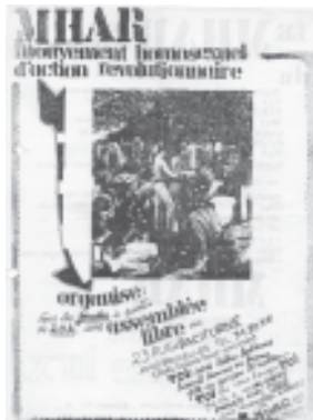
Un tract du MHAR.