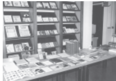
Een deel van de uitgestalde schatten uit onze eigen collectie.