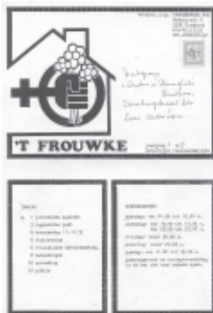
't Frouwke, tijdschrift van het Vrouwenhuis Turnhout.

De laatste jaren werkt ze vooral mee aan Vieux Rose. "Mijn generatie vrouwen is dikwijls getrouwd geweest, en hebben dus kinderen en kleinkinderen. In zekere zin is daardoor hun 'oude dag' verzekerd. Maar degenen die na ons volgen, hebben dat niet meer, en zij gaan alleen vallen. Daar moeten we dus nu al iets aan doen. Dat is inderdaad opnieuw dat verantwoordelijkheidsgevoel dat in mij zit." Terzelfder tijd blijft ze zich voor een stuk ergeren aan de lesbische vrouwen die zich