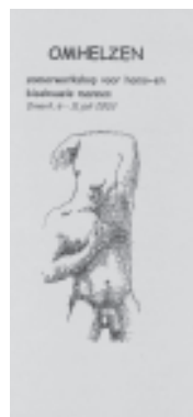
Folder van een workshop van Lingam.

En nu? Vrouwen hebben een historie van vechten achter zich. Vrouwenonderdrukking is een erkend maatschappelijk en politiek probleem. Er zijn theorieën ontwikkeld, er worden assertiviteitstrainingen georganiseerd, er zijn duizenden boeken