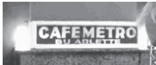
Een recente aanwinst: de originele lichtbak van café Metro.