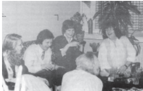
Foto uit de Homokrant (1980) betreffende de TV-uitzending 'Gewoon hetzelfde'.