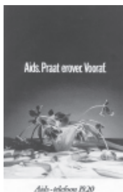
Brochure van de StAG.