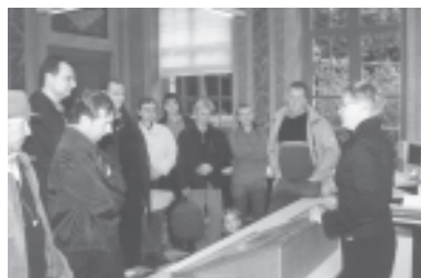
De stadsarchivaris licht de eeuwenoude documenten toe.

De succesvolle opendeurdag op zaterdag 9 oktober was niet enkel een gelegenheid om stil te staan bij het werk en de collectie van het Fonds Suzan Daniel zelf.