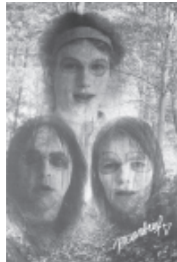
Maanbrief, publicatie van de antipatriërchale groep Behext.

Een presentatie over mannenemancipatie in Vlaanderen zou natuurlijk onmogelijk zijn als ik koppig aan de herinneringen uit mijn jeugd blijf vasthouden. Trouwens ook mijn herinneringen worden steeds onduidelijker. Maar wat we toen deden, vroeg in de jaren zeventig, was onmiskenbaar en direct geïnspireerd door de zogenaamde tweede feministische golf: de strijd tegen het patriërchaat, tegen mannen-geweld, tegen seksisme. Het waren hoofdzakelijk vrouwen en mannen uit linkse, progressieve milieus die zich daarmee bezighielden. We balden onze vuist en zongen het Mariënnenlied ("Verlos de maatschappij van de tirannen..."). Maar het liedje duurde niet lang want ook linkse mannen zaten vast in een machocultuur, egootjes die zich erg belangrijk vonden, onnodig lang aan het woord, jagend op status en vooral niet verlegen om tussen pot en pint te vuilbekken over vrouwen en... homo's. Linkse mannen met handen en voeten gebonden aan een gedetermineerd machobestaan bleven wel strijdliezen zingen maar de vrouwen zongen niet meer mee en gingen zich, heel terecht, apart organiseren. Het was trouwens vrij zinloos om als onderdrukte vrouwen samen met mannen te ageren tegen mannendominantie. Juist dit